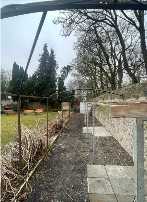
Aktueller Stand der Arbeiten am Laubengang