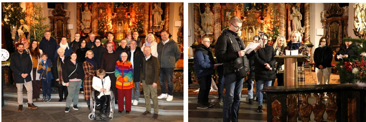
Hoch oben Gottesdienst gestaltet von den Freunden und Bereichen des Frauenbergs

Wir sind dankbar für jedes Mitglied. Machen Sie gerne auch andere auf die Freunde des Frauenbergs aufmerksam und stärken Sie somit unseren Verein, die Kooperation und diesen besonderen Ort – nach dem Motto „ Freunde werben Freunde “. Informationen finden Sie unter www.frauenberg-fulda.de/freunde-des-frauenbergs.html